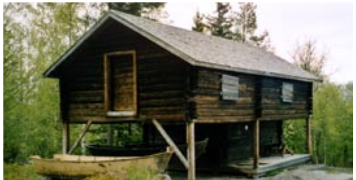
Tack vara Nolby byamän och Njurunda hembygdsförening finns Notstugan från 1800-talets Svartvik bevarad. Den kan ses på Klockarberget där ett flottningsmuseum skall inrättas.