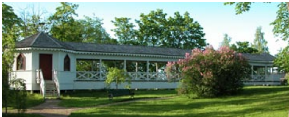
Kägelbanan i Engelska parken vid Svartviks herrgård.