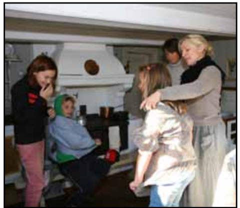
Svartviks skola på besök i Gillska stugan 2007.

kom redan tidigare) har 36 programkvällar plus flera föreläsningar och guidning under sommaren ordnats.