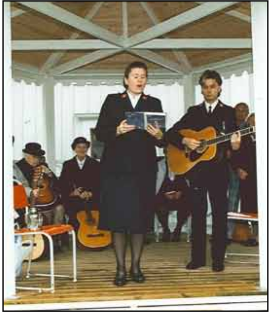
1995 Frälsningsarmén återkom några år, men kåren upphörde med tiden. 2000 Unikt för detta år var veteranfordonen på Svartvik. En almanacka framställdes med bilder från evenemanget.

En jämförelse av programmen visar att det 1995 och 2000 fanns en återkommande stomme på 10 likadana programpunkter. Antal föreläsningar var två -95 och sedan en, omfattningen av guidningar var större – kastellplatsen besöktes -95 och invigningsceremonierna var mer omfattande med bl a elevmedverkan. Detta trots att programmet börjar en timme senare bägge dagarna 2000. Man kan säga att arrangemangen har slimmats fram till sekelskiftet. Antalet inslag var i stort sett lika. De båda åren hade 6-7 program som skildes sig mellan åren.