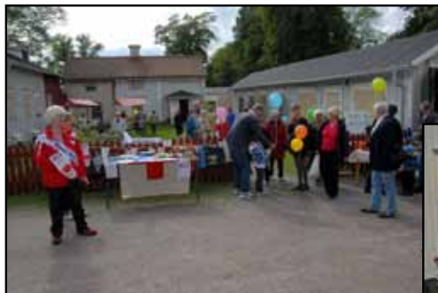
Röda Korset fanns med i år