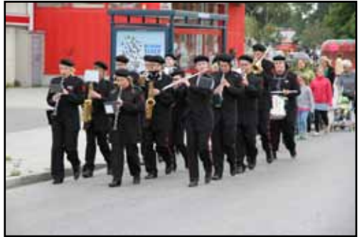
Kulturskolans paradorkester ledde Barnens Dags tåget