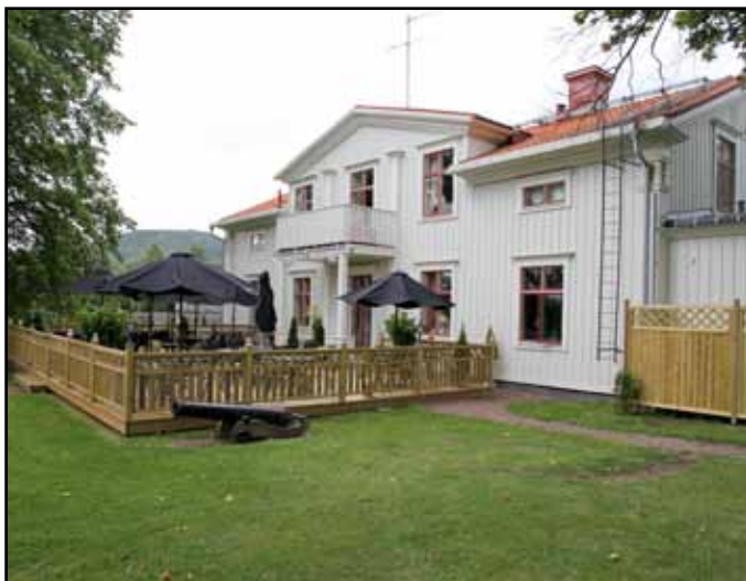
Herrgården med den nybyggda uteserveringen.

Den nya uteserveringen är en investering på runt 150 000 och till det kommer bord och parasoller. Satsningen på musik hade man under 11 veckor i sommar och fort-