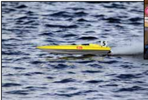
Sundsvalls modellbåtklubb visade ettrigt snabba farkoster