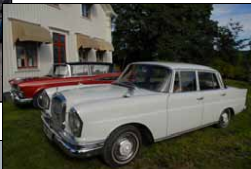
Veteranbilar visades vid herrgårdens södra gavel.