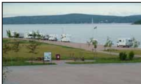
En vanlig syn på kajen under sommaren.

Svartvikskajen nu färdigställd med träd, gräsplanteringar mm. Tanken med området är att det skall vara en plats för spontan fritidsverksamhet – inte låst med fotbollsplan eller andra fasta arrangemang. Husvagns- och husbilsfolket har snabbt funnit en "underbar plats nära havet". Här kan man tala om Kustväg.